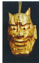
能面ストラップ 1/30・2/1