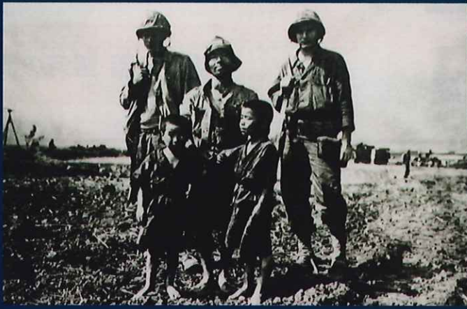
「米兵 2 人に付き添われる日本兵と 2 人の少年」