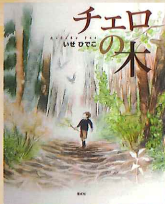
作・絵：いせひでこ チェロの木 (偕成社)