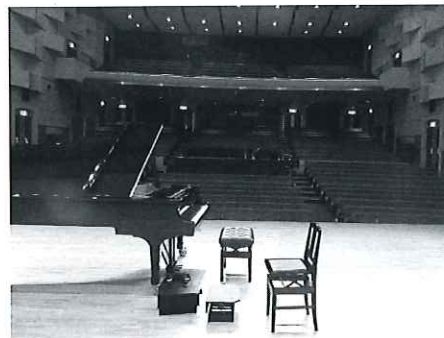
(写真) すばるホール