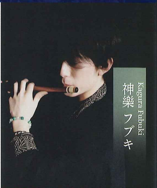
Kagura Fubuki 神楽 フブキ