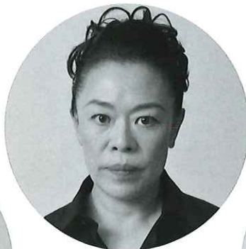
柴田理恵 Rie Shibata