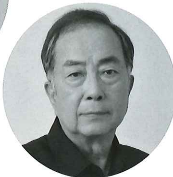
大和田獏 Baku Owada