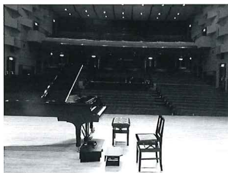
(写真) すばるホール